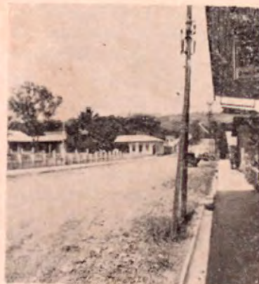
Una calle de Tilarán