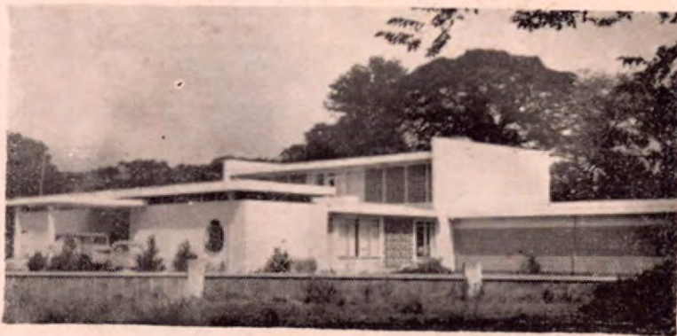
Edificio del Palacio Obispal en la ciudad de Tilarán