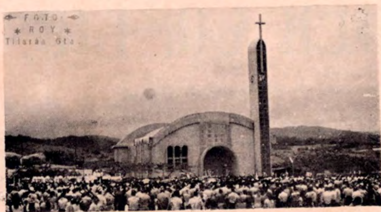
La Iglesia de Tilarán. Misa en la Plaza Deportiva de celebración del año de la fe.

En el ramo educacional se seguía una línea paralela, habiendo aumentado el número de maestros. Por acuerdo N° 417 del 2.º de julio de 1916, se señalaba como límite sur del Distrito Escolar de Quebrada Grande, pero en 1917 la Junta de Educación informó al Ministerio que dicho límite era la Quebrada de La Cabra. Manteníanse para lo administrativo, el nombre de Tilarán,